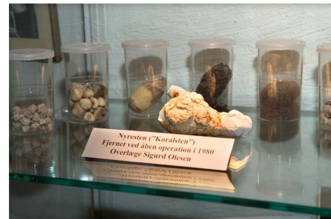
Nyresten fjernet ved operationer.