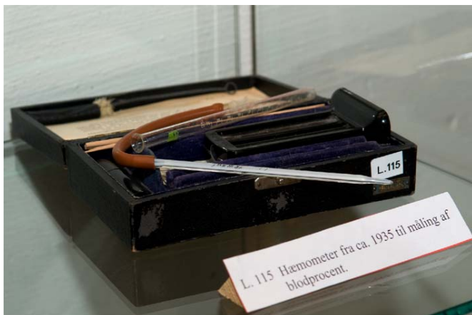
Hæmometer til måling af blodprocent.