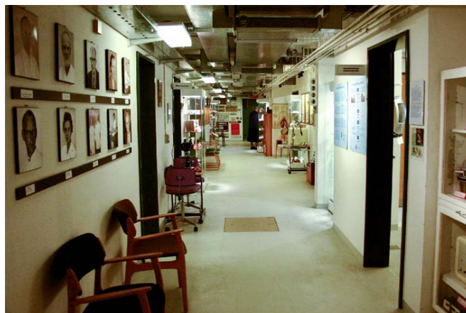
Galleri, montre på gangen med indgang til forskellige specialstuer

Besøgstallet er siden steget støt år for år. Museet er indrettet med 21 afdelinger, der indeholder det meste af det inventar, der er brugt fra 1950-erne og frem. På museet ses en omfattende samling af fotos, lavet af sygehuseets egne fotografer, der vises også korte DVD film om nye operationsmetoder m. v.